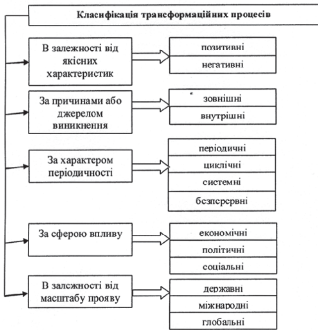
Рис. 1. Класифікація трансформаційних процесів

ної діяльності, зміну її цільової спрямованості [14].