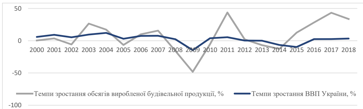
Рис. 2. Динаміка темпів зростання обсягів виробленої будівельної продукції в Україні та ВВП України у 1990 – 2018 рр. (у % до попереднього року) [1,2]

Переважає більшість вітчизняних забудовників із запізненням реагує на зміну фази економічного циклу Кітчина. Вітчизняні будівельні компанії зазвичай різко знижують обсяги будівництва тільки після початку фази рецесії, а нарощувати їх починають часто лише на фазі піднесення, тобто як раз напередодні чергової рецесії. Особливо вираженою вказана залежність є у житловому будівництві. При цьому, якщо згадати, що переважна більшість інвестиційно-будівельних проектів у сфері житлового багатоквартирного будівництва має тривалість біля 3-4 років (що відповідає тривалості економічного циклу Кітчина), то стає зрозумілим, чому завершення більшості із цих проектів припадає на фази рецесії та депресії, що часто змушує будівельні організації зупиняти будівництво і загрожує їм банкрутством.