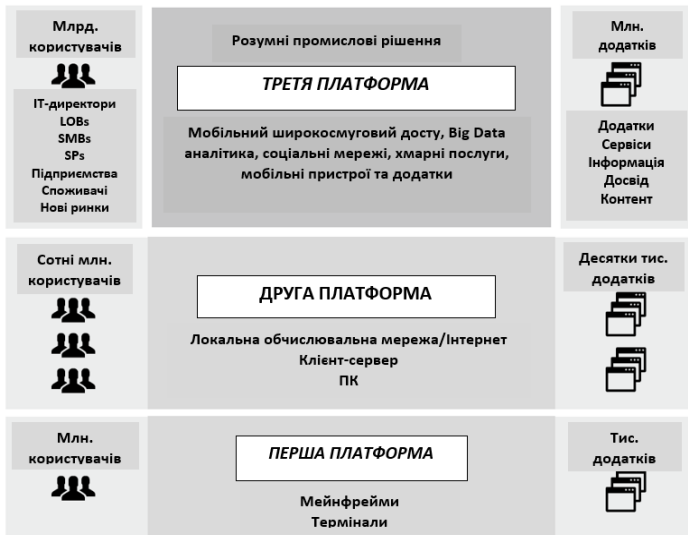
Рис. 1. Етапи розвитку інформаційних технологій [3, с. 25]

Проблематика цифрової трансформації промислових підприємств набула розвитку у концепції «Індустрія 4.0», ядром якої є ідея «Розумної (цифрової, віртуальної) фабрики», основні характеристики якої узагальнено представлено на рис. 2.