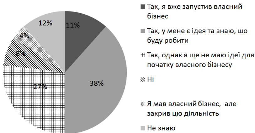
Рис.1. Розподіл відповідей на запитання «Чи розглядали Ви можливість розпочати власний бізнес?»