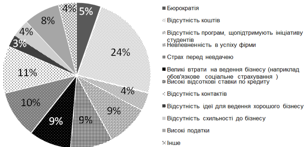
Рис. 4. Розподіл відповідей на запитання «Що для Вас є бар'єром для початку власного бізнесу?»

Що стосується об'єктивних і суб'єктивних перешкод і бар'єрів, з якими стикається саме молодь при створенні власного бізнесу, то ми отримали такі результати опитування (рис. 4).