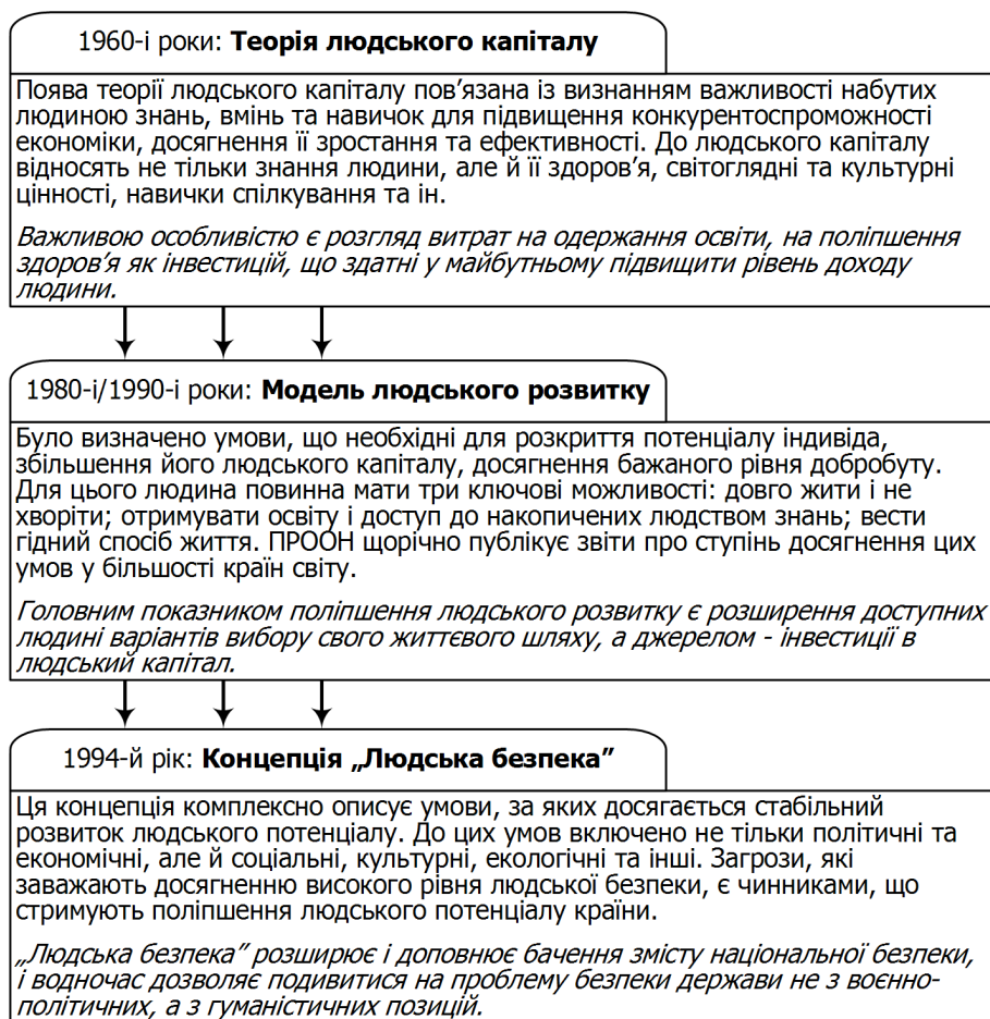
Рисунок 2. Концептуальні попередники моделі людської безпеки

добре відомі [3] й активно розробляються, тоді як модель людської безпеки ще залишається поза широкою увагою наукової й фахової спільноти, вона згадується лише у кількох українських та російських публікаціях [1; 2; 5].