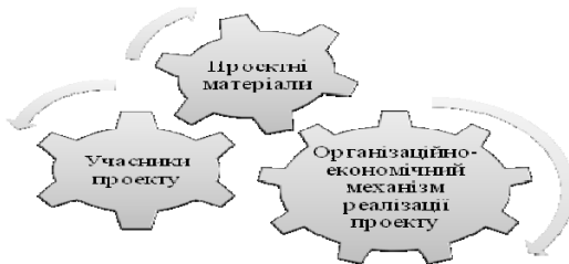
Рис. 2. Структура інвестиційного проекту

Для визначення особливостей управління проектом потрібно його структурувати. Структура проекту — організація зв'язків між його елементами. Як бачимо з рис. 2, структура інвестиційного проекту характеризує його цілісність та єдність усіх елементів.