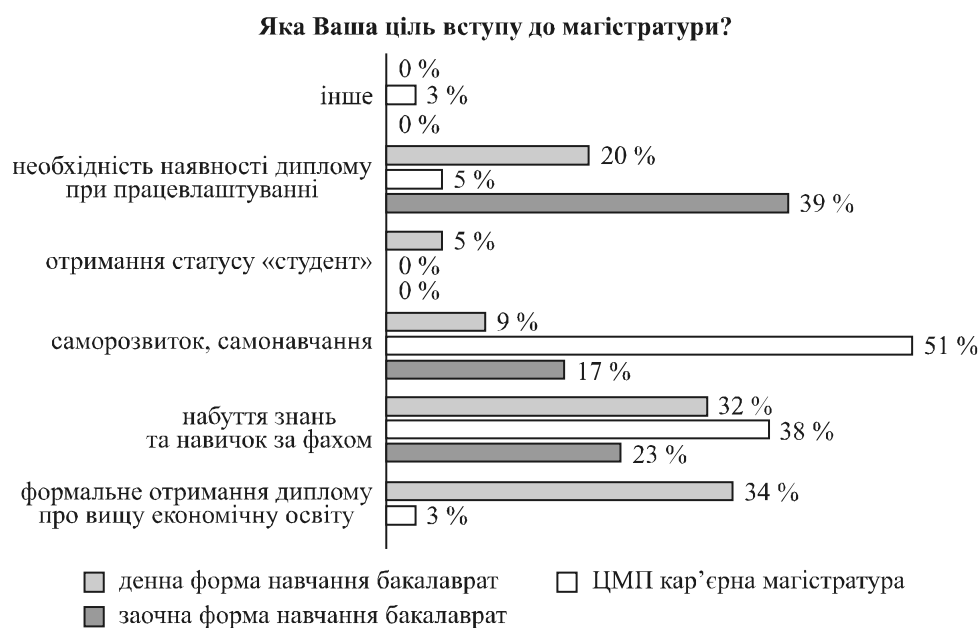
Рис. 1. Структура цільових орієнтирів навчання у магістратурі

Намагаючись виявити потреби та очікування студентів від магістратури, було встановлено, що слухачі кар'єрної магістратури Центру магістерської підготовки КНЕУ (надалі ЦМП) продемонстрували доволі високу прихильність до фундаментальних цінностей у вищій освіті: понад половини опитуваних (51 %) заявили, що поступили до кар'єрної магістратури задля саморозвитку та самонавчання. 38 % опитуваних намагаються отримати саме фахову підготовку (рис. 1).