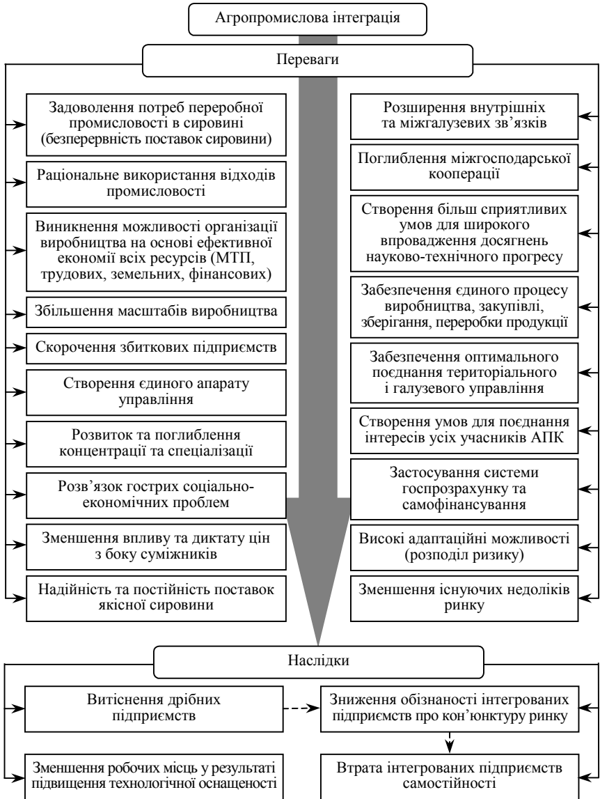
Рис. 1. Переваги та наслідки агропромислової інтеграції

вані на спеціалізації виробництва та переробки будь-якої провідної сільськогосподарської культури.