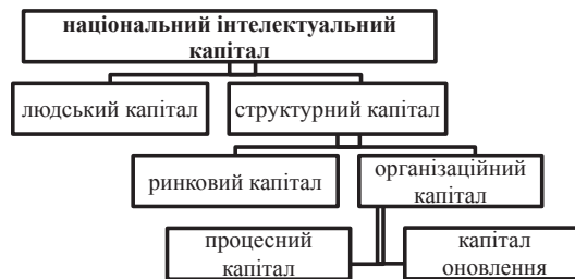
Рис. 2. Структура національного інтелектуального капіталу

тку. Його структурними компонентами є людський капітал та структурний капітал, що складається з ринкового та організаційного капіталів, який формують процесний капітал та капітал оновлення (рис. 2). Людський капітал характеризується потенціалом і можливостями населення країни та є компетенціями людей, що реалізують національні інтереси. До нього відносять знання, компетенції, ставлення, інтелектуальну спроможність людей. Ринковий капітал, що за своєю суттю є близьким до капіталу зовнішніх мереж відносин та соціального капіталу, визначає глобальну привабливість бізнесу, створені умови та стимули для задоволення потреб міжнародних клієнтів та обміну знаннями, знаннево-інтенсивними товарами та послугами.