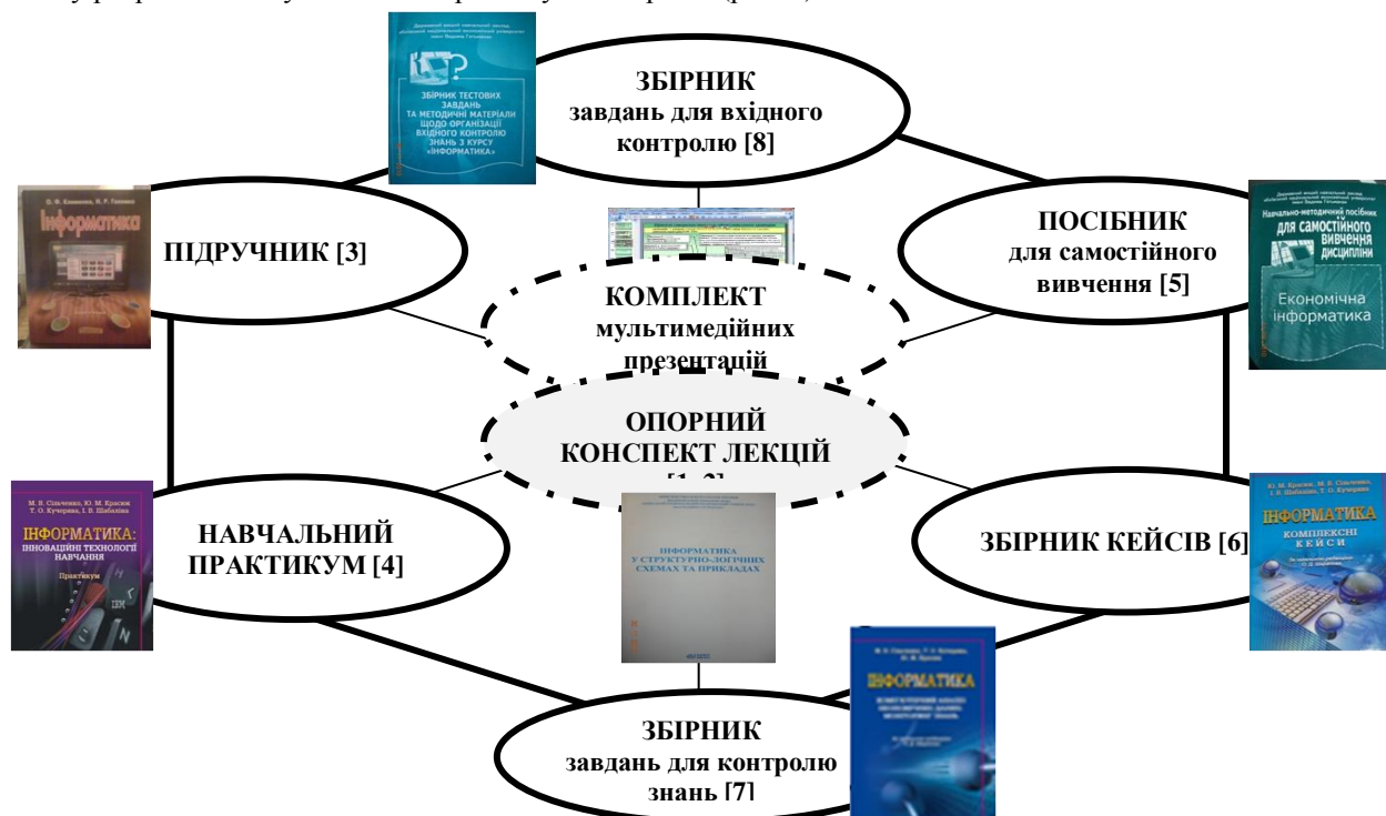
Рис. 1. Структура навчально-методичного комплексу з інформатики

навчанні першокурсників економічних спеціальностей навчально-методичний комплекс з інформатики (рис. 1).