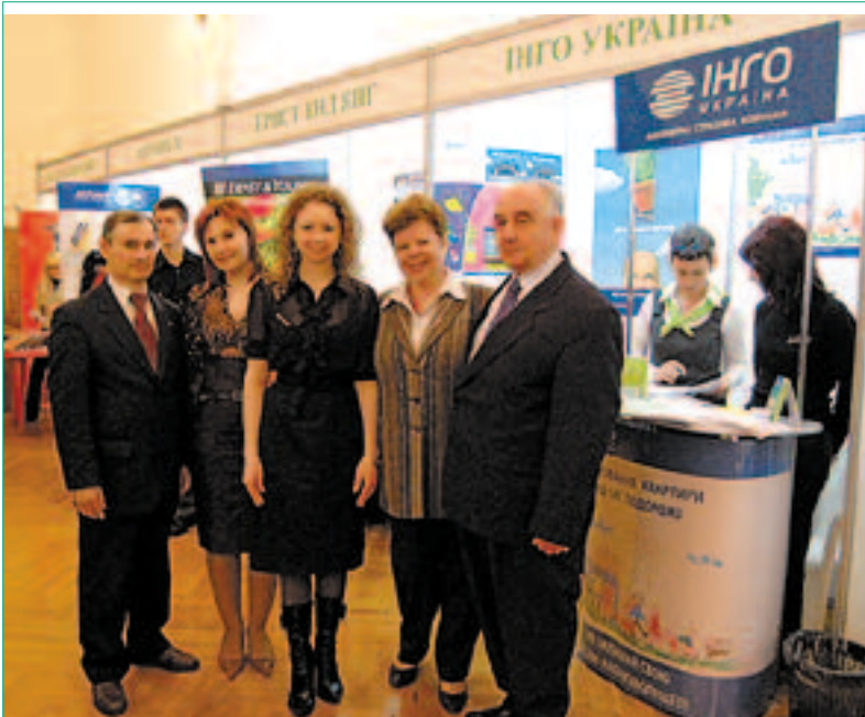
Наприкінці квітня, служби персоналу відомих компаній взяли участь у проєкті «День кар'єри-2008» організованому та проведеному в нашому університеті Центром зв'язків з роботодавцями та сприяння працевлаштування студентів «Перспектива».