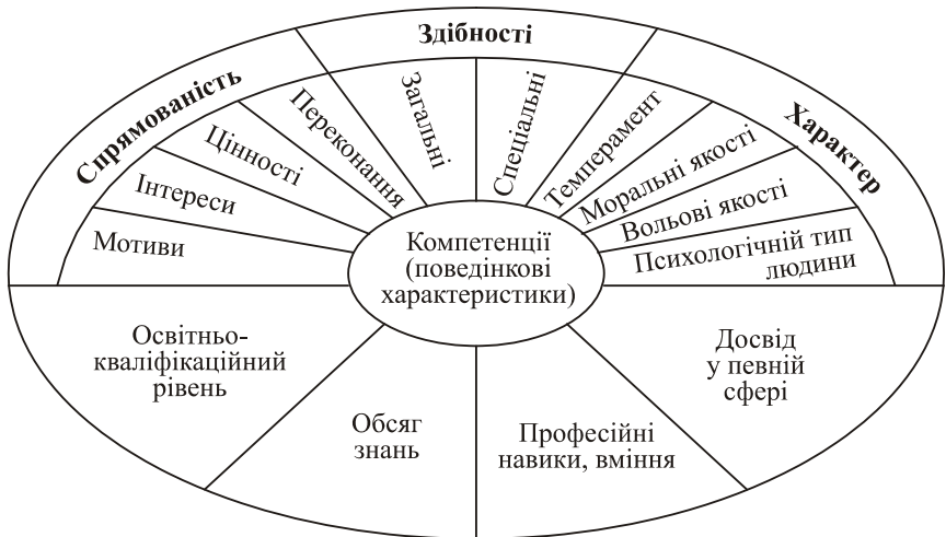
Рис. 1. Схема формування компетенцій фахівця

Компетенції забезпечуються, з однієї сторони, відповідними знаннями, досвідом, навичками, а з іншої — необхідними психофізіологічними та психологічними властивостями людини. Тому доцільно представити формування компетенцій у вигляді схеми як результат раціонального поєднання здібностей, характерологічних особливостей, спрямованості особистості, здобутих знань, навиків та досвіду (рис. 1).