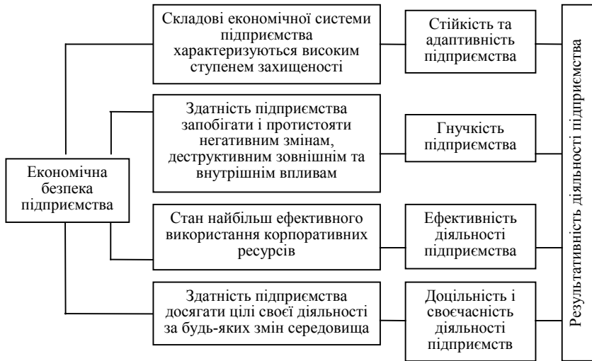
Рис. 1. Загальні підходи до розуміння економічної безпеки та результативності діяльності підприємства

емства слід вважати досягнення стану захищеності і гарантованості реалізації ним системи цільових орієнтирів. Разом з цим, досягнення цього стану та його підтримка у короткостроковій чи довгостроковій перспективі слід вважати неможливим без досягнення відповідних цільових, своєчасних результатів діяльності підприємства.