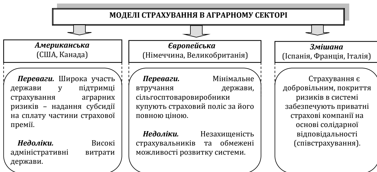
Рис. 1. Сукупність моделей страхування в галузі сільськогосподарського виробництва

Причому світовий досвід свідчить, що в міжнародній практиці страхування сільськогосподарських ризиків сформувались дві основні моделі, які умовно можна назвати «американська» та «європейська». Для «американської» моделі, яка застосовується в США та Канаді, характерна значна підтримка держави у страхуванні сільськогосподарських ризиків.