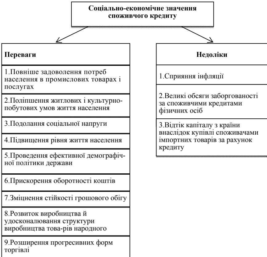
Рис. 1. Соціально-економічне значення споживчого кредиту

Наявність елементів ризику, якими неодмінно супроводжується процес надання споживчого кредиту, породжує необхідність їхнього попередження, відшкодування, зменшення збиткових наслідків. Важливе місце у функціонуванні споживчого кредиту посідає питання управління ризиками. Необхідність мінімізації ризиків спонукає до необхідності пошуку різних способів протидії як першопричинам ризиків, так і їх наслідкам. Саме тому споживчий кредит потребує функціонування системи страхування ризиків.