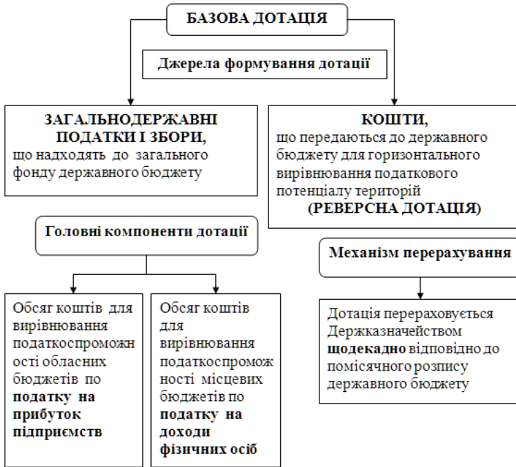
Рис. 2. Складові розрахунку та надання базової дотації