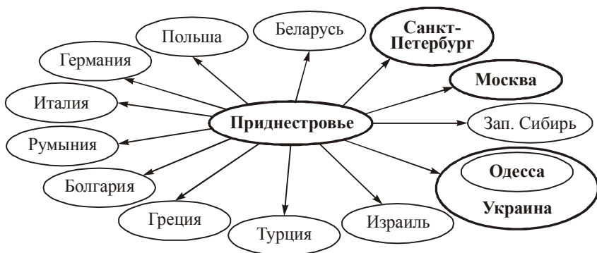
Рис. 2. География эмиграционных связей Приднестровья*

творенность людей низкой заработной платой, уровнем жизни и социального обеспечения, неуклонное снижение количества рабочих мест, неопределенность политико-правового статуса республики. За 20 лет существования ПМР ее миграционные потери достигли 90 тыс. чел. или почти 17 % населения. Причем, большинство выезжающих составляют представители наиболее экономически активной и трудоспособной группы граждан (23—35 лет). Молодежь покидает Приднестровье преимущественно безвозвратно. К вышеперечисленным факторам, способствующим эмиграции, следует добавить неустойчивую работу многих предприятий, недостаточно высокую заработную плату в аналогичных видах деятельности по сравнению с сопредельными странами (Украиной, Россией, Белоруссией, странами ЕС), стимулирующих поиск более высокооплачиваемой работы и желание самореализации, выезд на учебу в другие страны. Среди причин эмиграции можно выделить и стремление значительной части населения воссоединиться с исторической Родиной (в первую очередь, с Россией, Украиной, Израилем, Германией) [5; 9] (рис. 2).