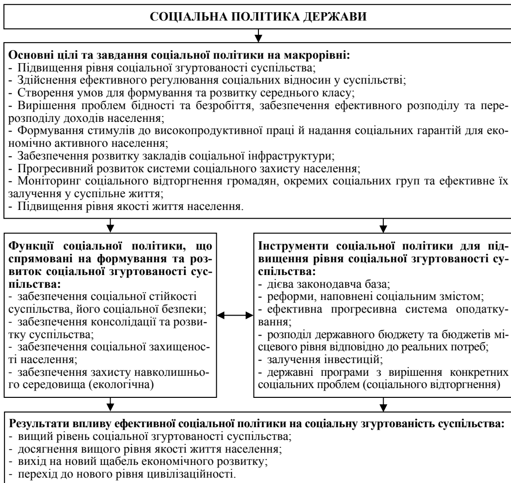
Рис. 2. Складові механізму впливу соціальної політики на соціальну згуртованість суспільства

Механізм впливу соціальної політики на соціальну згуртованість суспільства розглянуто на рис. 2. Складовими цього механізму визначено основні цілі та завдання, функції (забезпечення соціальної стійкості та безпеки, забезпечення консолідації та розвитку суспільства, забезпечення соціальної захищеності населення), інструменти та результати впливу соціальної політики держави на соціальну згуртованість суспільства.