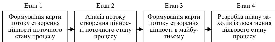
Рис. 2. Послідовність етапів застосування інструменту картування

Незважаючи на безліч порад і відточену технологію, при аналізі виробничих процесів іноді виникають труднощі з визначенням кінцевого споживача. Цей аспект сильно впливає на міру деталізації дій і цілей картування. Однак, у більшості випадків дослідники, які застосовують метод картування, дотримуються наступної послідовності етапів його реалізації (рис. 2).