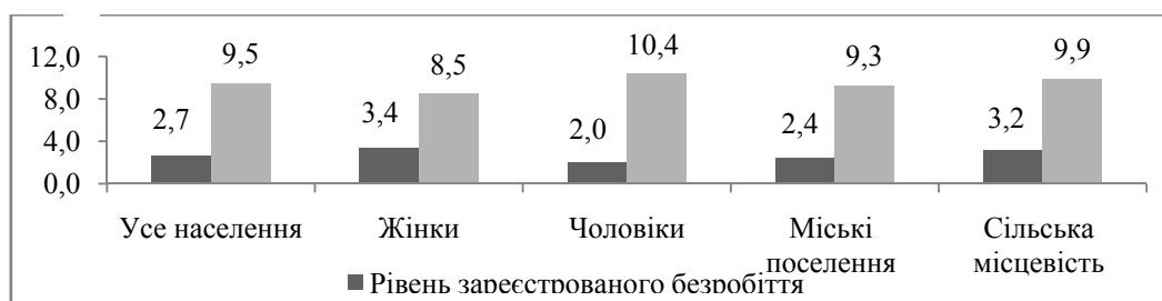
Рис. 2. Безробіття серед економічно активного населення працездатного віку за статтю та місцем проживання у 2015 році

у 2,5 разу, чоловіків — у 5,2 разу, міських поселеннях — у 3,9 разу, сільській місцевості — у 3,1 разу) (рис. 2).