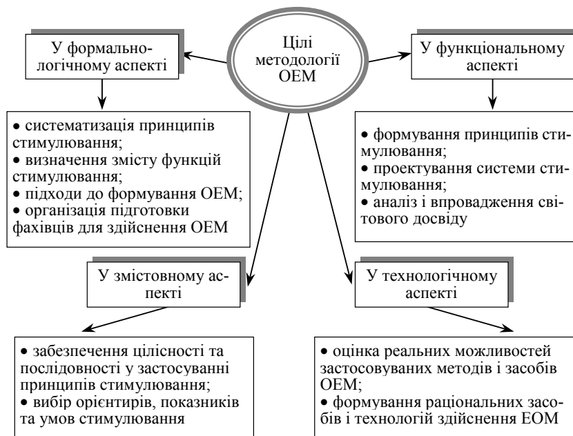
Рис. 2. Класифікація цілей методології OEM

У сучасній методології управлінської діяльності основні підходи до її організації та практичного здійснення визначаються насамперед сукупністю тих чинників, що обираються як домінуючі. Залежно від цього, основними прийнято вважати цільовий, діяльнісний та особистісний підходи (рис. 3).