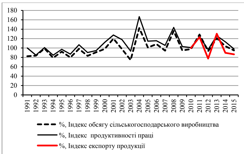
Рис. 3. Індекси обсягу виробництва та експорту продукції та продуктивності праці у сільськогосподарських підприємствах (1991–2015 рр.), % до попереднього року.