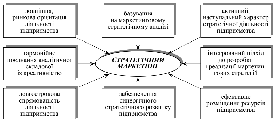
Рис. 1. Принципи стратегічного маркетингу

Основні принципи стратегічного маркетингу представлено на рис. 1: