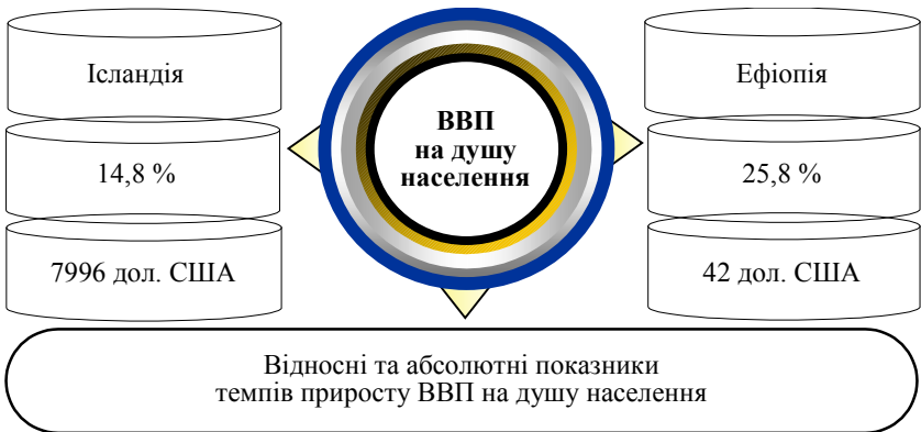
Рис. 3. Диспропорції економічного розвитку Ісландії та Ефіопії

Наприклад, темпи приросту ВВП на душу населення у 2007 році порівняно із 2006 склали 25,8 % у Ефіопії, яка входить до 5 держав із найнижчим показником ВВП на душу населення, та 14,8 % у Ісландії, яка входить до п'яти держав-лідерів за цим критерієм, натомість в абсолютних показниках ВВП на душу населення в Ефіопії за рік зросло лише на 42 долари США, в той час як в Ісландії — майже на 8000 доларів США.