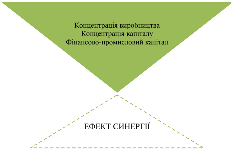
Рис. 3. Структурний зміст інтегрованої корпоративної структури

Отримання синергетичного ефекту, одержуваного в результаті консолідації крупних капіталів у структурі інтегрованої корпоративної структури залежить як від складу системоутворюючих елементів, так і від способу їх об'єднання, гармонії зв'язків між ними, іншими словами від організаційної цілісності. Чим більш різноманітними і комплексними є взаємозв'язки, тим більшою є кількість способів взаємодії між привернутими в систему елементами, тим вище організаційний потенціал системи як цілісного утворення. Це означає, що наявність або відсутність синергетичного ефекту об'єднання капіталів залежить від вибору форми інтегрованої корпоративної структури.