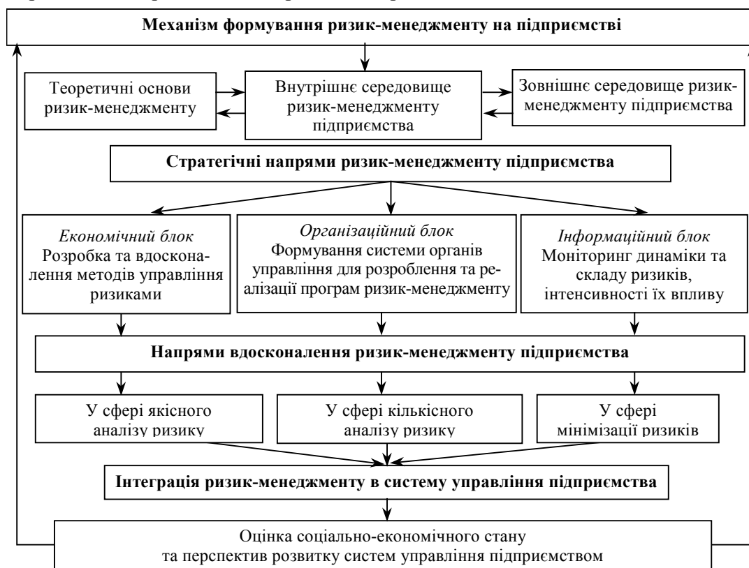
Рис. 2. Механізм формування ризик-менеджменту на підприємстві

ний на зниження втрат від ризикових операцій або взагалі їх уникнення. Ризико-захищеність операційної діяльності підприємства пов'язана з основною діяльністю підприємства, ключовими елементами якої є реалізація товарів, робіт (послуг) в проведенні маркетингової стратегії підприємства.