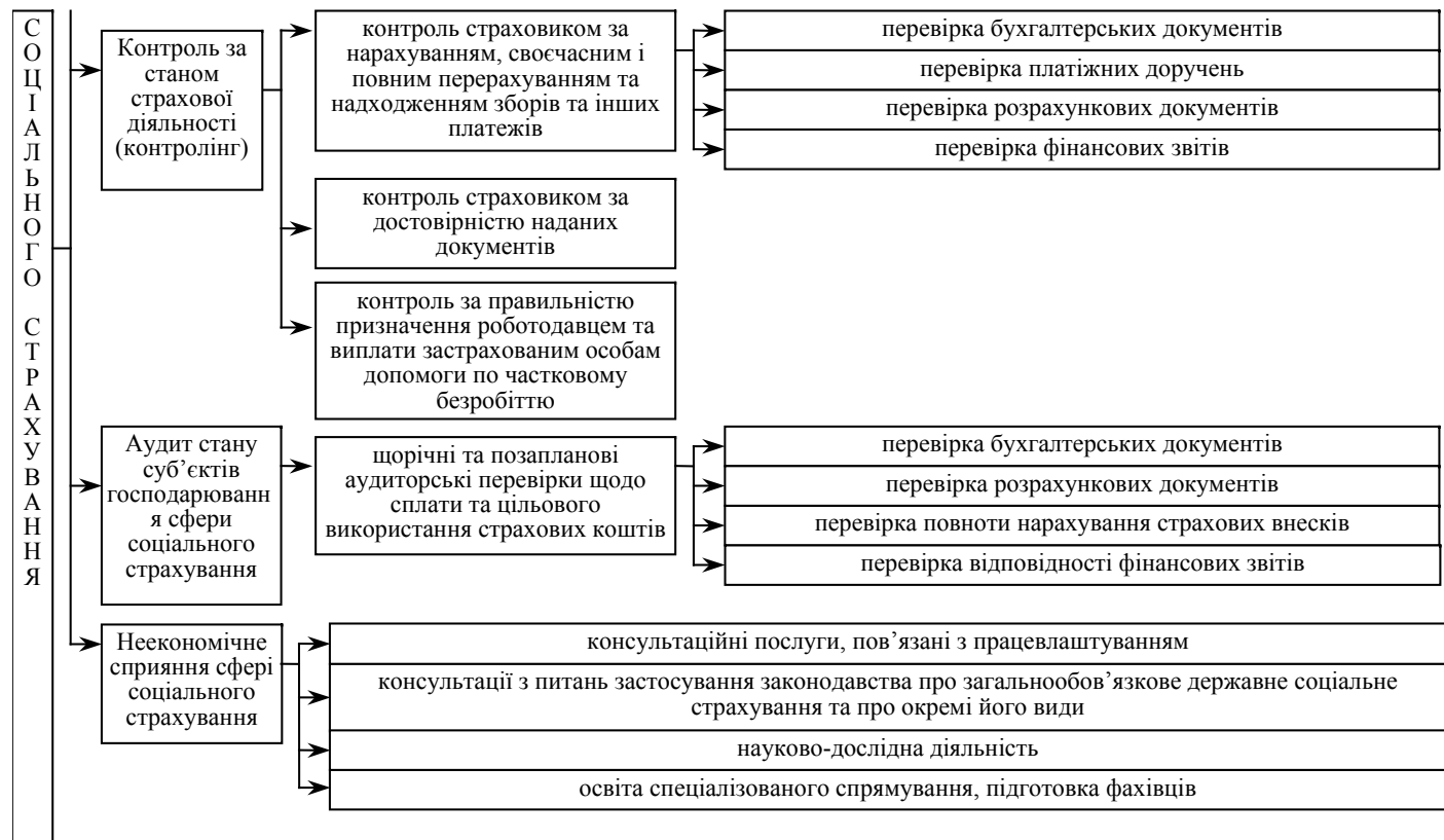
Рис. 1. Структура організаційного механізму соціального страхування та його інструментарію