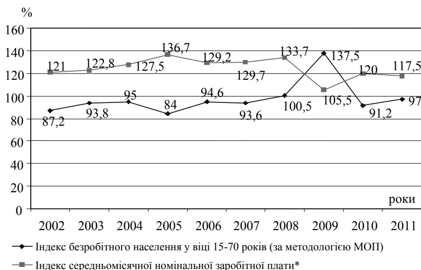
Рис. 2. Порівняння індексів безробітного населення і середньомісячної заробітної плати за 2002—2011 рр.

заробітної плати [6]. Однак, слід зауважити, що на даний момент, в умовах розвитку ринкових відносин, подібне ствердження не буде цілком вірним, оскільки на появу безробіття впливає безліч різних чинників, серед яких збільшення заробітної плати не відіграє суттєвої ролі. Про справедливість даного ствердження свідчать дані Державної служби статистики (рис. 2). Індекси безробітного населення і середньомісячної заробітної плати свідчать про те, що протягом 2002—2011 рр. спостерігалось значне зростання номінальної заробітної плати з одночасним зменшенням безробіття серед осіб у віці 15—70 років.