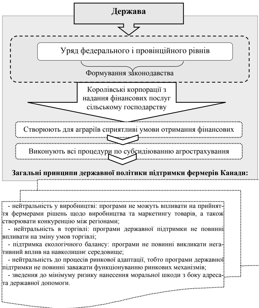
Рис. 1. Модель державної політики страхування сільськогосподарських культур Канади