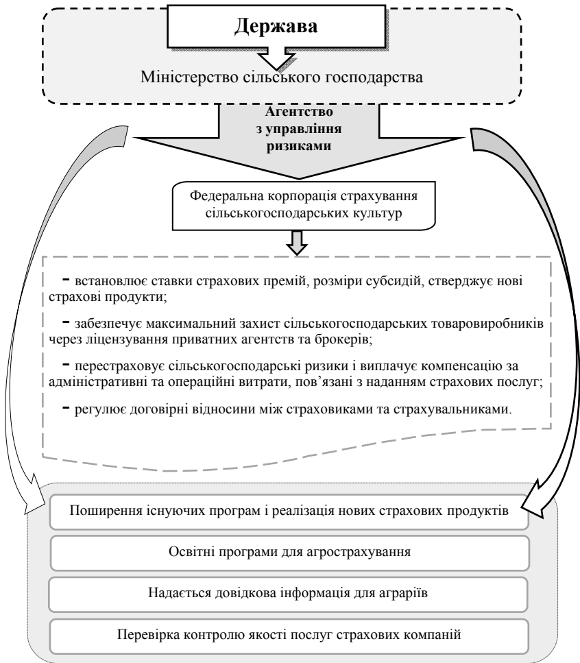
Рис. 2. Модель державної політики страхування сільськогосподарських культур США

страхування сільськогосподарської продукції. Модель державної політики страхування сільськогосподарських культур, представлено рис. 2.