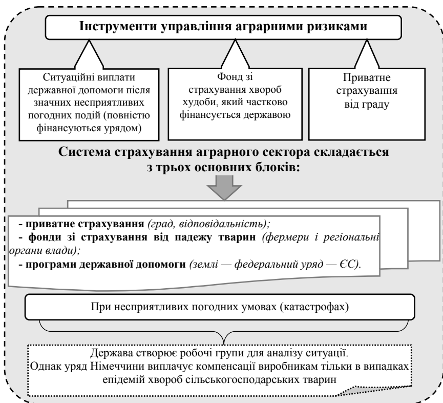
Рис. 4. Модель державної політики страхування сільськогосподарських культур Німеччини