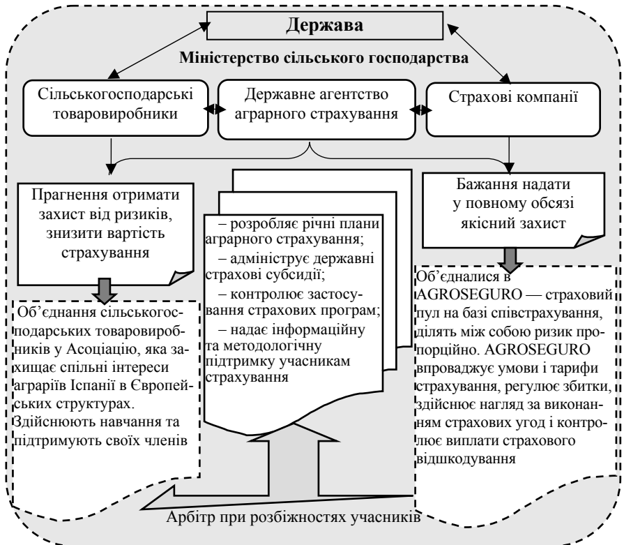
Рис. 5. Модель державної політики страхування сільськогосподарських культур Іспанії

Приклад змішаної моделі державної політики страхування являє собою Іспанія. Іспанська модель є найбільш ефективною і орієнтована на оптимальне поєднання інтересів держави, урядів провінцій і сільгосптоваровиробників, представлена рис. 5.