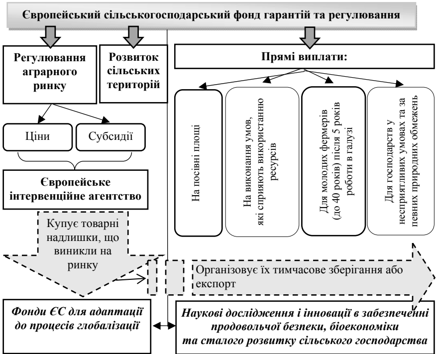
Рис. 3. Сучасна модель політики страхування сільськогосподарських культур у ЄС

Джерело: сформовано автором на основі джерел [2,3,5].