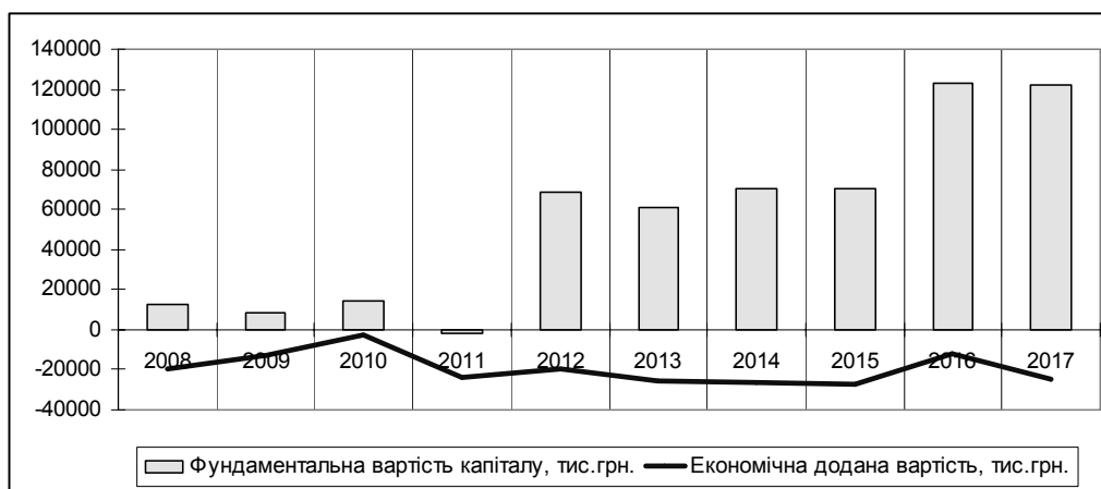
Рис. 2. Показники фундаментальної вартості капіталу та економічної доданої вартості ПрАТ «Козятинський м'ясокомбінат» у 2008—2017 рр.

Аналіз адаптації конкретних вітчизняних харчових підприємств до змін, що відбуваються у зовнішньому середовищі, дозволяє зробити такі узагальнення. Сьогодні наявність сучасної техніко-технологічної бази для харчових підприємств є обов'язковою, але не достатньою передумовою забезпечення ефективності їх діяльності та конкурентоспроможності. Так, наприклад, ПрАТ «Козятинський м'ясокомбінат» має техніко-технологічну базу, яка відповідає західним стандартам виробництва, протягом останніх восьми років є прибутковим, фундаментальна вартість капіталу за останні десять років зростає майже у 10 разів (рис. 2), при цьому, підприємство генерує лише від'ємні потоки економічної доданої вартості бізнесу, торговельна марка підприємства FOODWORK є майже невідомою вітчизняному споживачеві, фізичні обсяги виробництва мають спадну динаміку, асортимент продукції протягом останніх років майже не змінився.