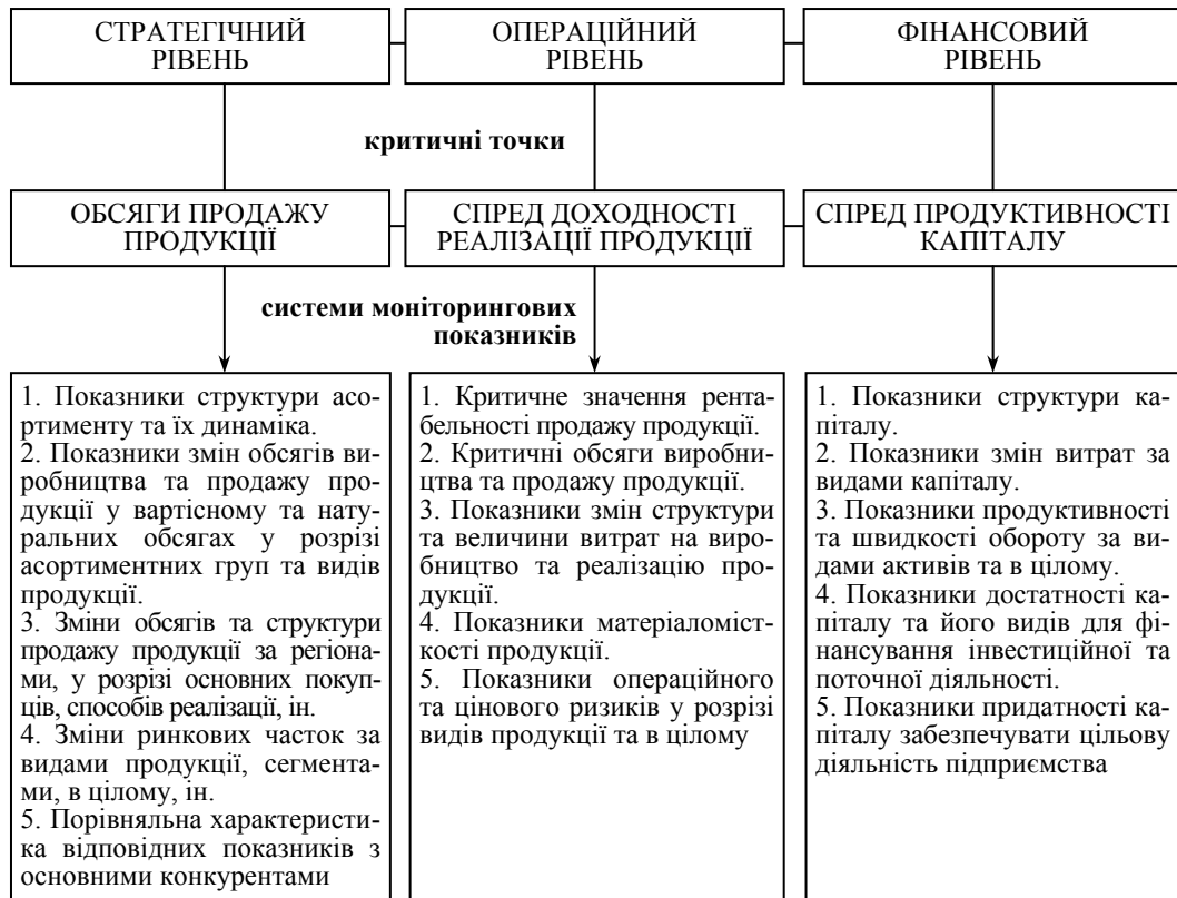
Рис. 3. Система критичних точок і моніторингових показників оцінювання адаптації харчових підприємств

Якщо говорити про систему критичних точок, в аспекті аналізу рівня адаптації харчових підприємств, то їх умовно можна представити у єдності взаємозв'язку таких аспектів: обсяги виробництва та продажу продукції; спред доходності реалізації продукції, спред продуктивності капіталу. Відповідно до змісту кожного з визначених аспектів формується система моніторингових показників, які є інформативними з точки зору аналізу причинно-наслідкових зв'язків, що впливають на зміни базових індикаторів (рис. 3).