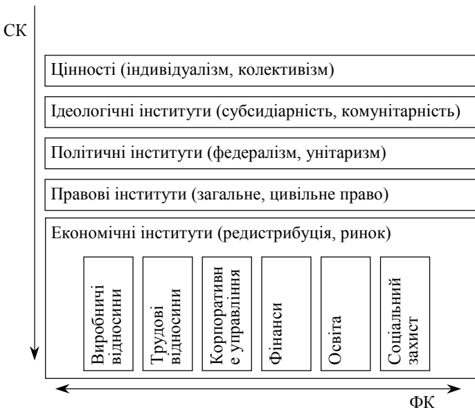
Рис. 1. Компоненти структурної ІК СЕС

культурологічного підходу до пояснення особливостей існуючих СЕС та його критиками, що абсолютизують домінування в економічній діяльності суцього утилітарного, раціонального розрахунку. Якщо основу СК складають ціннісно-раціональні орієнтації суб'єктів господарювання, то ФК — їх цільова раціональність. Соціальні орієнтації задають загальний дискурс формування відповідних інститутів. Їх специфіка в межах конкретної СЕС задається такими чинниками, як природно-географічні та кліматичні умови, природно-ресурсний потенціал, національна культура, попередній історичний досвід (Path dependence), особливості укладу господарювання, структура економіки, зовнішнє оточення.