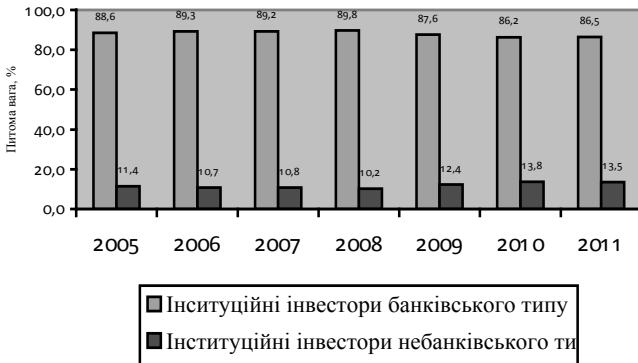
Рис. 1 Розподіл активів інституційних інвесторів в Україні в 2005—2011 рр.*

3) залишається значна диспропорція між активами інституційних інвесторів банківського та небанківського типу (рис. 1):