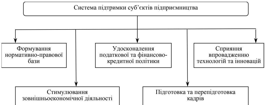
Рис. 2. Система державної підтримки суб'єктів підприємництва

Виходячи з вищезазначеного, складові елементи системи державної підтримки суб'єктів підприємницької діяльності пропонуємо подати у вигляді наступної схеми (рис. 2).