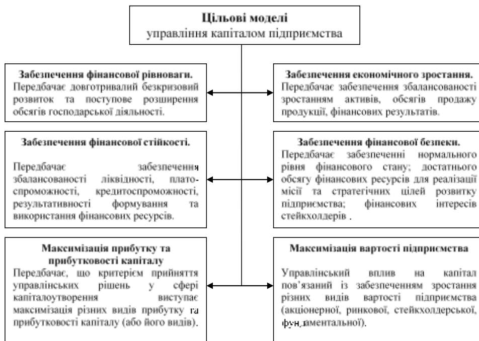
Рисунок 1. Цільові моделі управління капіталом підприємства

Результати. Багатоаспектність та, відповідно, неоднозначність сутнісних інтерпретацій результативності потребує авторського уточнення змісту «результативності управління капіталом підприємства», під якою ми будемо розуміти рівень досягнення поставлених цілей щодо спрямованих впливів на капітал підприємства. Результати аналізу цільових моделей управління капіталом підприємства, які формалізовано представлено на рис. 1, дозволяють говорити про їх поступовий розвиток та сутнісне ускладнення, а найбільш узагальнюючим змістом характеризується цільова модель, в основу якої закладено вартісний критерій.