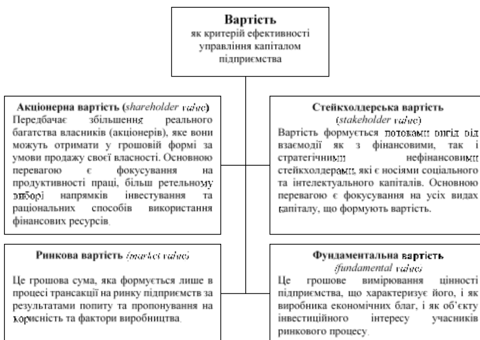
Рисунок 2. Видова характеристика вартості як критерію ефективності управління капіталом підприємства

Ще одним моментом, що потребує змістовного уточнення, є обґрунтування вибору виду вартості як критерію прийняття управлінських рішень в аспекті капіталоутворення на підприємстві. У такій змістовній постановці науковці фокусуються на ринковій, акціонерній, стейкхолдерській, фундаментальній вартості (рис. 2), кожна з яких має свої переваги та обмеження у використанні як критерію результативності управління капіталом.