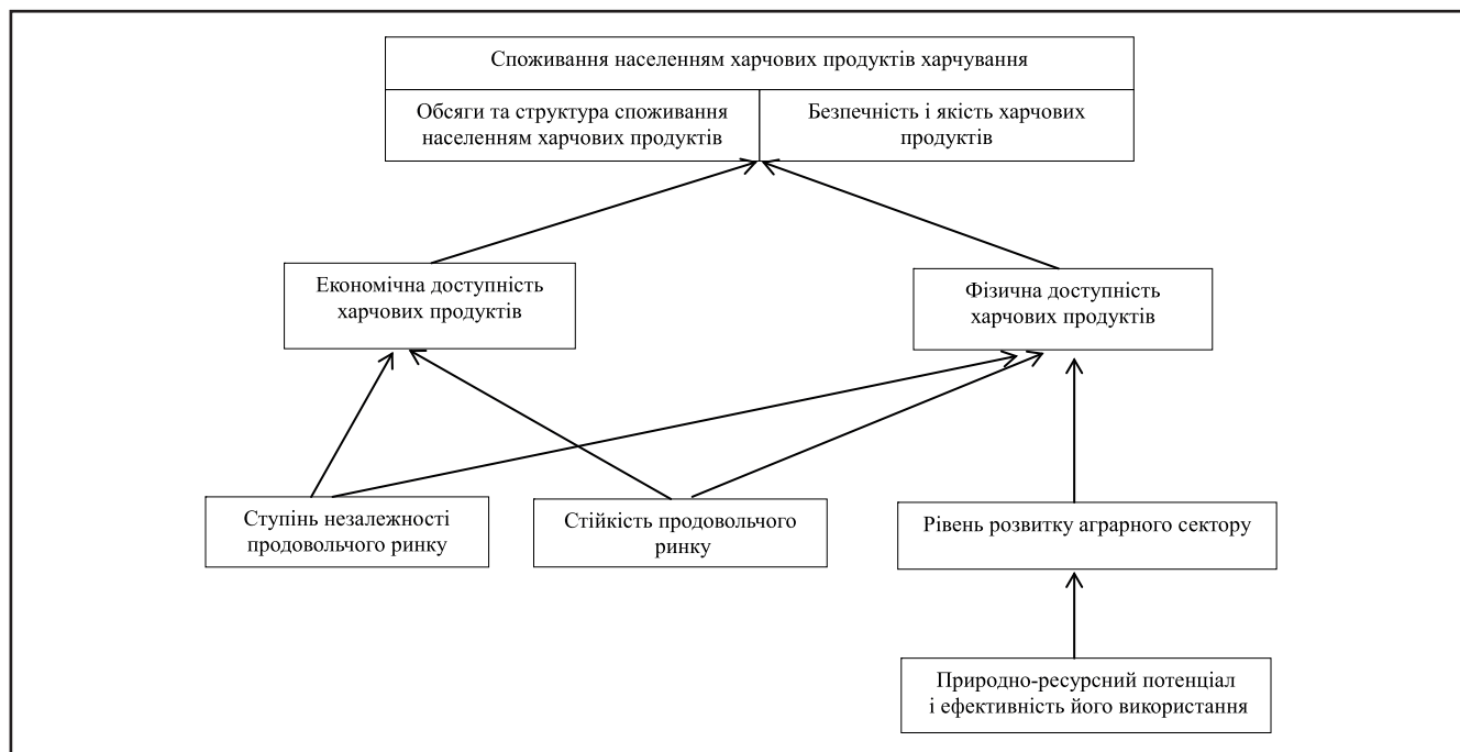
Рисунок 1. Система індикаторів оцінювання рівня продовольчої безпеки

Як показує аналіз табл. 1, середньодушові обсяги споживання таких продуктів харчування, як м'ясо, молоко та фрукти, не досягають раціональних норм навіть у регіонах з максимальними обсягами споживання даних продуктів, а середньодушові обсяги споживання риби у 2013 році в середньому за регіонами становили лише 69% від раціональних норм. Мінімальні за регіонами України середньодушові обсяги споживання продуктів усіх продовольчих груп у 2013 році були меншими за раціональні. Таким чином, хоча за розглядуваний період часу з 2000 по 2013 рік обсяги споживання базових продуктів харчування суттєво підвищились, проте залишилась певна незбалансованість структури споживання внаслідок непропорційно високого рівня споживання продуктів харчування, що є основними постачальниками енергії та вуглеводів (хліб, картопля, олія) на фоні пониженого спожив-