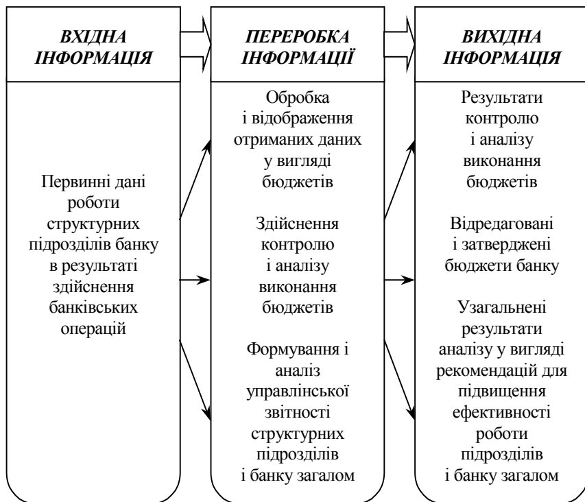
Рис. 1. Технологія обробки управлінської інформації

очно технологію обробки управлінської інформації ілюструє рис. 1.