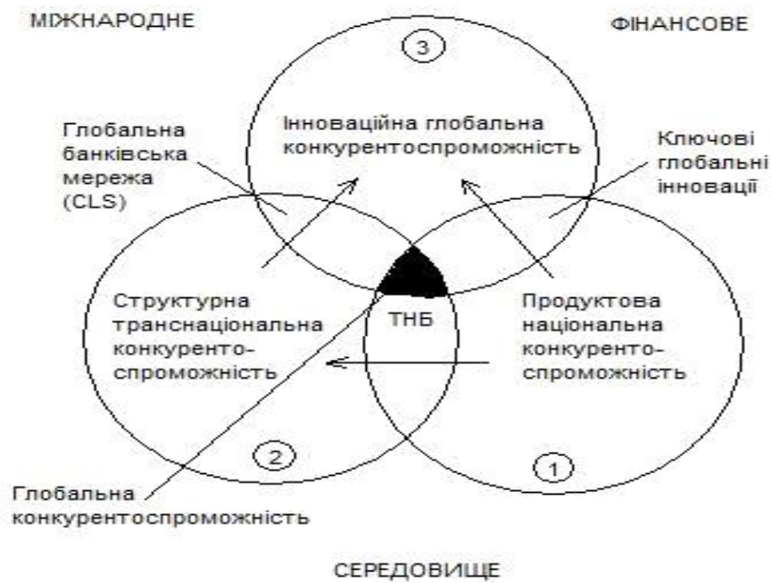
Рис. 2. Модель глобальної конкурентоспроможності транснаціонального банку

вих інновацій, які, у свою чергу, є її рушійною силою. Інноваційність, з одного боку, виявляється в багатьох аспектах фінансової глобалізації, а з другого – виконує роль джерела подальшого поглиблення цього процесу» [13, с. 224].