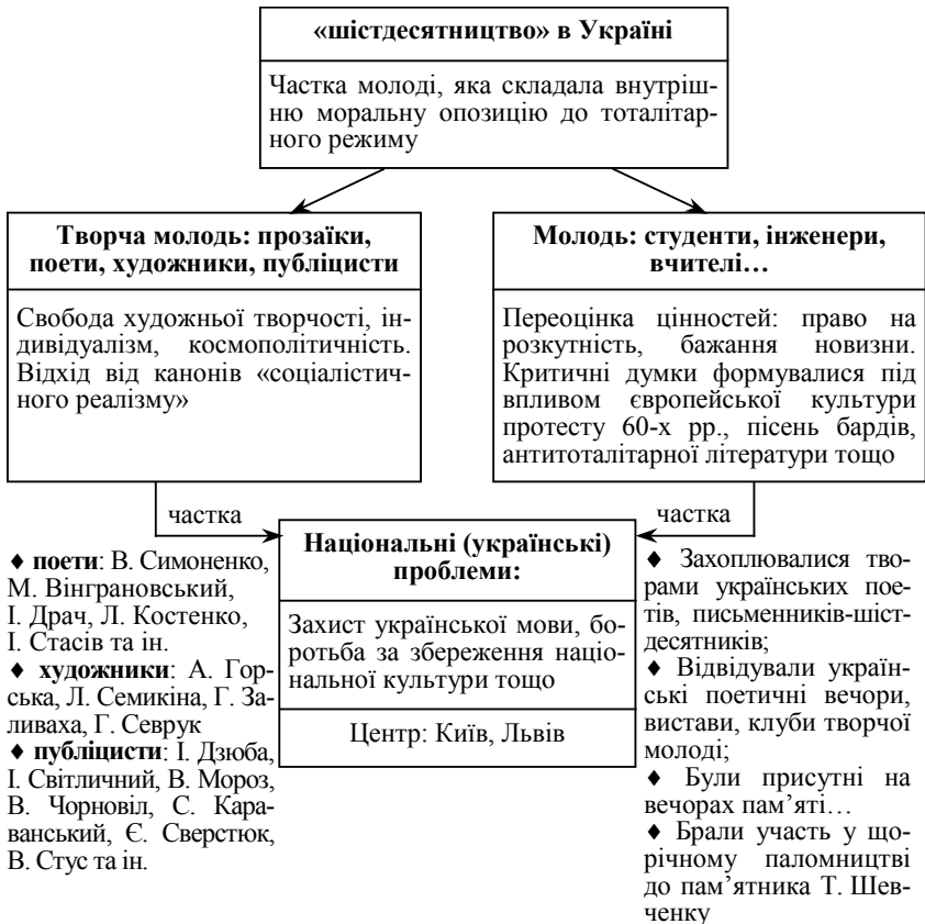
Рис. 2. Взаємозв'язок національно-орієнтованих шістдесятників і усіх шістдесятників в Україні

Рух українців-шістдесятників був інтелігентським по суті, але в Україні не відчувалося такої прірви між національною інтелігенцією і народом, як у росіяні; українські патріоти-інтелігенти ідентифікували себе його органічною частиною, можливо, через неукраїнський склад більшості міського населення та партійно-господарської бюрократії, а також тому, що більшість їх — інтелігенти у першому поколінні, вихідці з українських сіл (стара українська інтелігенція була майже поголовно знищена в довоєнні роки) [3, с. 10].