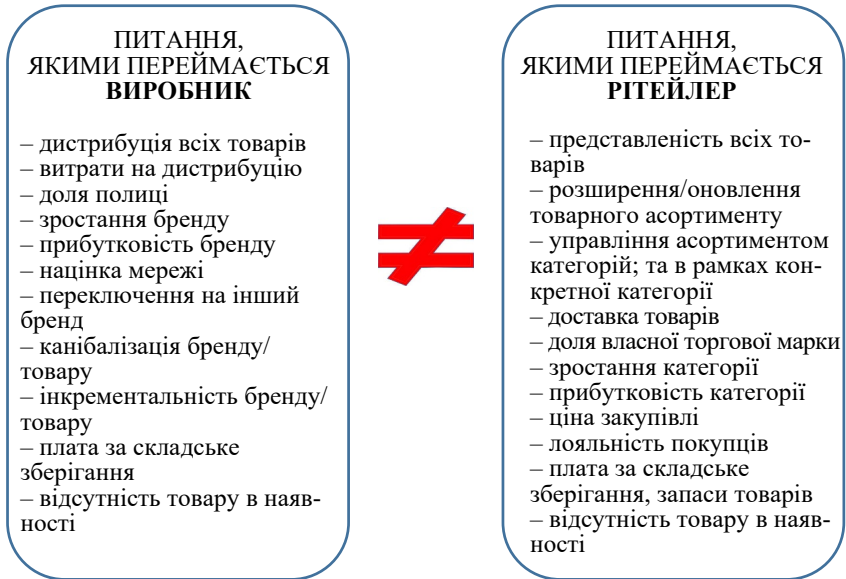
Рис. 2. Конфлікти інтересів виробника та ритейлера

приємств харчової промисловості мають чітко визначити та нейтралізувати конфлікти інтересів всіх учасників товаропробування, основні передумови яких систематизовано на рис. 2.