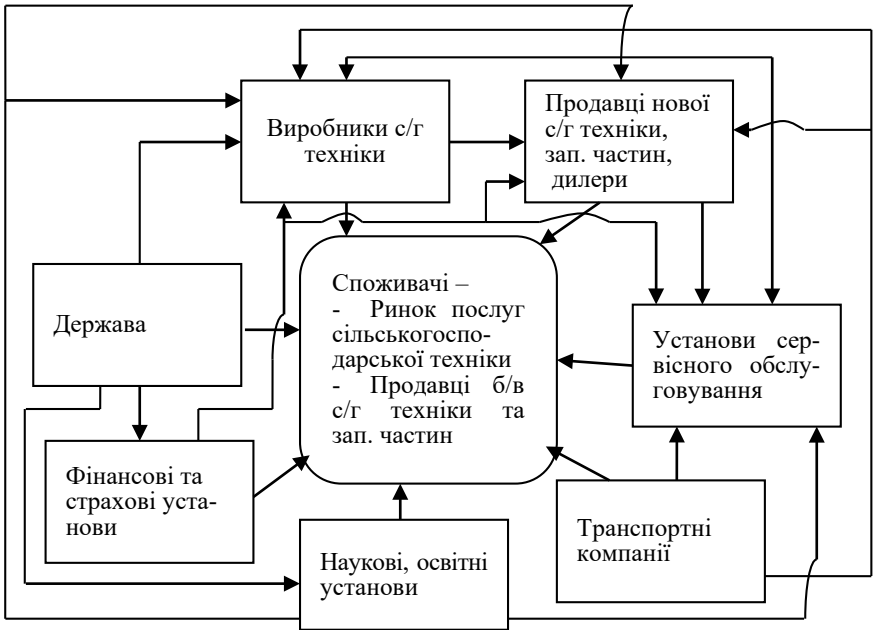
Рис. 1. Загальна функціональна схема ринку сільськогосподарської техніки

- системно-функціональний . Для досягнення загальної мети, корисного результату або сукупності цілей система виконує певні функції. До головних функцій ринку відносяться; відтворювальна, регулююча, контрольна, стимулююча та інтегруюча. Структурні елементи системи ринку агротехніки функціонують між собою на основі ринкових механізмів, які визначаються попитом, пропозицією, ціною та конкуренцією. На загальній функціональній схемі ринку сільськогосподарської техніки показані всі суб'єкти ринку та їх зв'язки (взаємовідносини), враховуючи це можливо аналізувати, досліджувати ринок, пропонувати необхідні рекомендації щодо його функціонування (рис. 1);