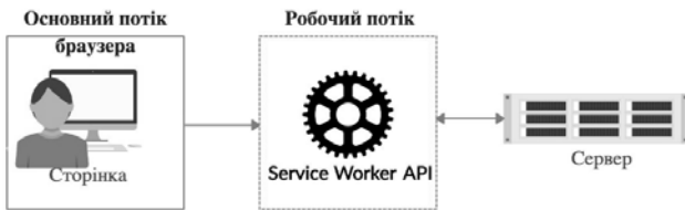
Рис. 1. Схема роботи Service Worker

Service Worker реєструється під час першого відвідування сторінки користувача, перехоплює вхідні та вихідні http-запити та надає повний контроль над вебсайтом (рис. 1).