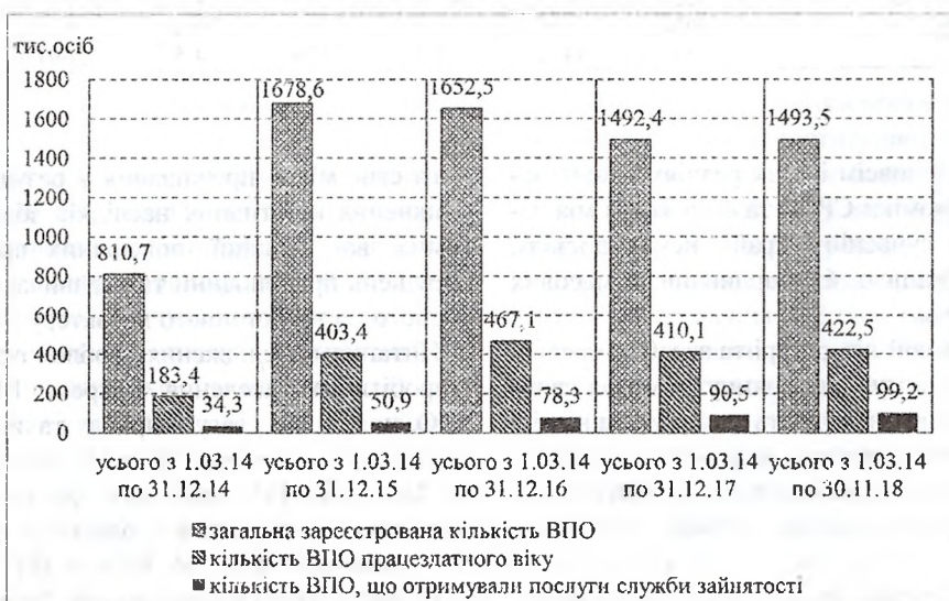
Рис. 1. Кількість зареєстрованих ВПО за окремими групами, 2014–2018 рр.

Частка осіб працездатного віку у структурі ВПО за ці роки не перевищувала 28,3%, тобто переважна більшість переселенців – це діти та особи похилого віку. Найменший цей показник був зафіксований станом на кінець 2014 р. (22,6%), і він невпинно зростає щороку,