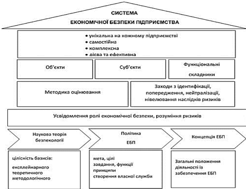
Рис. 1. Трактування системи економічної безпеки підприємства

суб'єктів і способів їх захисту, зв'язки та відносини між якими визначаються виконуваними системою функціями та режимом функціонування системи.