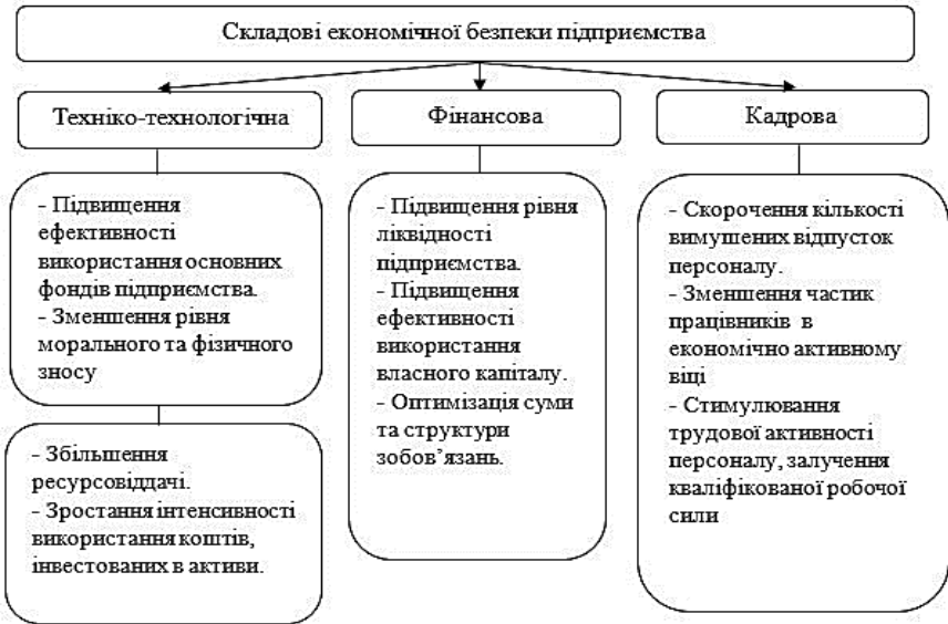
Рис. 2. Основні шляхи запобігання загрозам економічній безпеці підприємства

До інших зовнішніх загроз можна віднести: рівень інфляції, брак коштів для інвестування підприємства, законодавча нестабільність, корупція, несприятливі макроекономічні умови (криза, війна, загальноекономічна ситуація в країні). Основні шляхи запобігання загрозам економічній безпеці підприємства наведено на рис. 2.