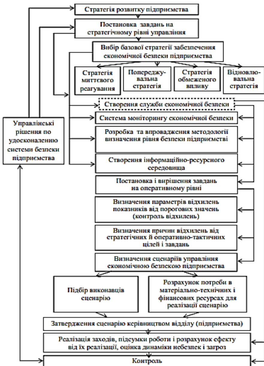
Рис. 3. Схема функціонування механізму управління в системі економічної безпеки підприємства