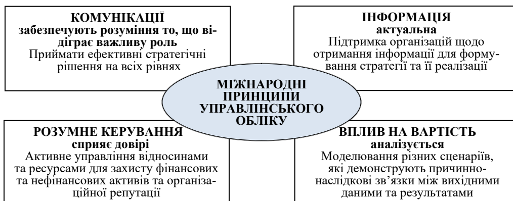
Рис. 3. Міжнародні принципи управлінського обліку за стандартами PAS 1919

Питання розвитку наукових підходів до формування управлінської звітності набули масштабного характеру та обговорення в контексті не тільки питань стійкого розвитку. Так, професійним об'єднанням «Сертифікований інститут фахівців з управлінського обліку» ( Chartered Institute of Management Accountants, CIMA ) у 2016 р. був розроблений перший у світі стандарт з управлінського обліку «Міжнародні принципи управлінського обліку» ( PAS 1919 ) [7], який передбачає реалізацію 4 принципових концептів — комунікації, інформація, вплив на створену вартість, відповідальне керування (рис. 3). А сама управлінська звітність, що розробляється та впроваджується за принципами та стандартами PAS 1919 може бути розглянута як один із концептуальних способів реалізації фундаментально-вартісного підходу до управління капіталом. Це пов'язано з тим, що призначення управлінської звітності ініціатори PAS 1919 вбачають у «зборі, аналізі та передачі релевантної для прийняття фінансових рішень фінансової та нефінансової інформації для цілей формування та підтримування вартості компанії» [7].