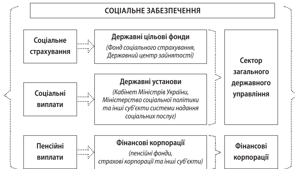
Рис. 2. Взаємозв'язок інституційних секторів економіки та розрахунків за соціальним забезпеченням

Побудовано за: Про затвердження Класифікації інституційних секторів економіки України : наказ Державної служби статистики України від 03.12.2014 № 378. URL: https://zakon.rada.gov.ua/rada/show/v0378832-14#Text .