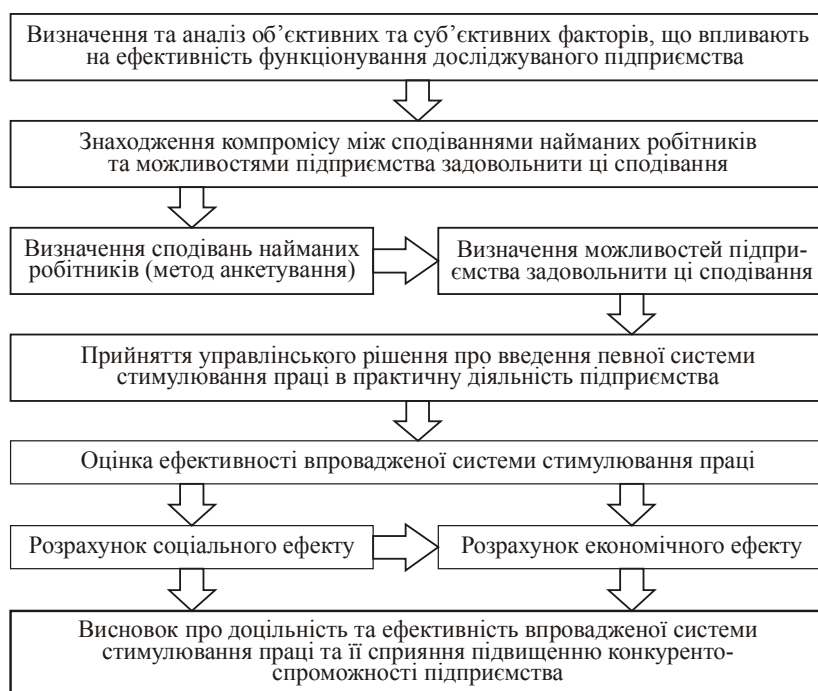
Рис. 2. Методика створення ССП на підприємстві.

як доцільна та сприяла б підвищенню конкурентоспроможності підприємства. У загальному вигляді ця методика представлена на рис. 2.