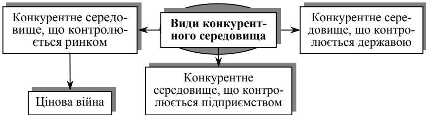
Рис. 2. Види конкурентного середовища

Середовище, де ціни контролюються ринком, відрізняється високим ступенем конкуренції, а також подібністю товарів і послуг. Саме в цьому середовищі підприємству важливо правильно встановити ціни. Завищені ціни відвернуть покупців і залучать їх до конкуруючого підприємства, а знижені ціни не забезпечать умов для продуктивної діяльності. Однак приховати від конкурентів успішну цінову стратегію неможливо. У зв'язку з цим перед керівництвом підприємства стоїть велике і важке завдання — побачити перспективи обраної стратегії цін, не допустити переростання конкуренції в цінові війни.