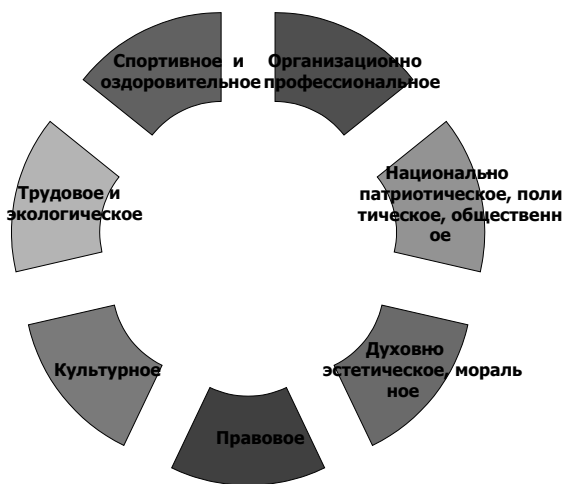
Рис. 2. Основные направления воспитательной работы деканата ФМТТД

Студенты факультета маркетинга, торговли и таможенного дела являются участниками и занимают ведущие призовые места на культурно-развлекательных внутревузовских и межвузовских мероприятиях. Таких как Дебюта первокурсника, Вокальный конкурс «Голос Юзовки», Студенческий форум ДонНУЭТ, «Юморина», конкурс «Мисс и мистер ДонНУЭТ», Межвузовский «Дебют первокурсника», Ежегодный сочинский фестиваль команд КВН КиВиН-2013 и др.