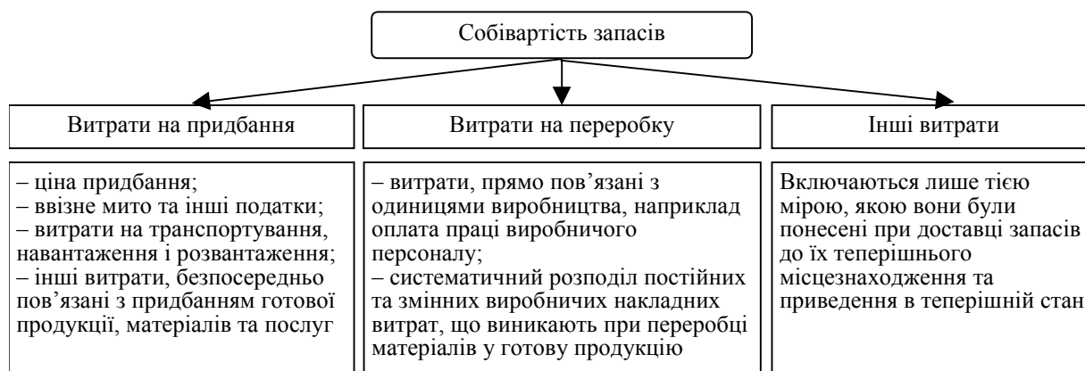
Рис. 2. Структура собівартості за МСБО 2 «Запаси»