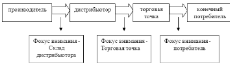
Схема № 1 Фокус внимания производителя на разных этапах развития

На первом этапе фокус внимания производителя направлен на дистрибьютора. На этом этапе развития дистрибьютор воспринимается производителем как «торговая точка». Соответственно, с точки зрения производителя основная задача дистрибьютора – «закупи как можно больше, продай сколько сможешь». Все его действия, т.е. шаги по достижению поставленной цели направ-