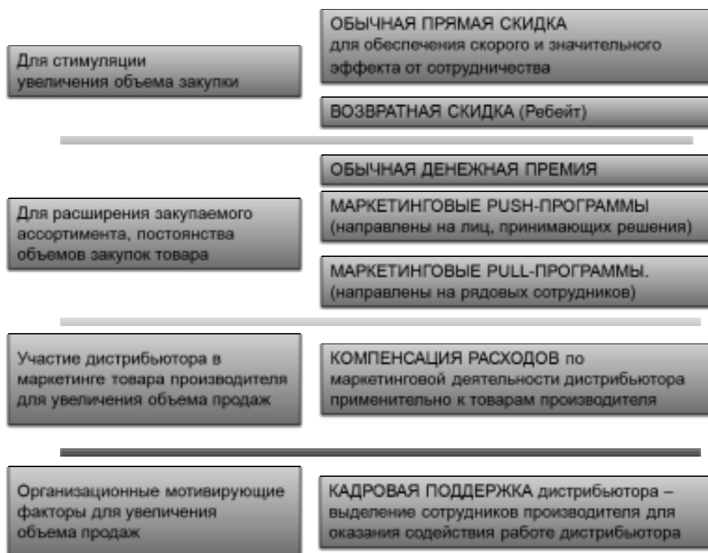
Рис.5 Основные схемы мотивации дистрибьютора

лены именно на «загрузку склада дистрибьютора». Для этого производитель использует различные виды скидок, маркетинговые pull-программы (акции, направленные на закупщиков или продавцов дистрибьютора) направлены именно на действия: «закупи как можно больше, продай сколько сможешь» (см. рис.5 Основные схемы мотивации дистрибьютора).