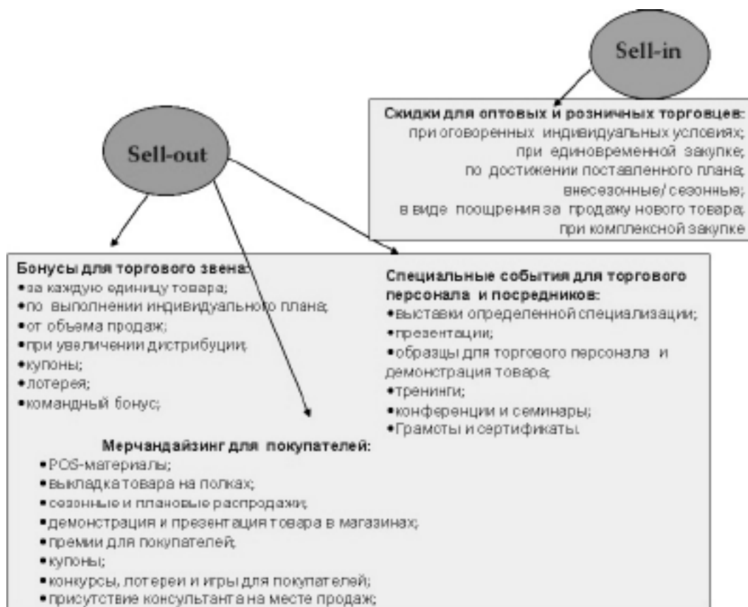
Рис.4 Инструменты торгового маркетинга

Поскольку основной целевой аудиторией (ЦА) торгового маркетинга являются посредники (продавцы, лица принимающие решение о закупках и т.п., более широко рассмотрим в этой статье чуть-чуть дальше) – давайте начнем с инструментов, которые помогают эффективней работать именно с этой ЦА.