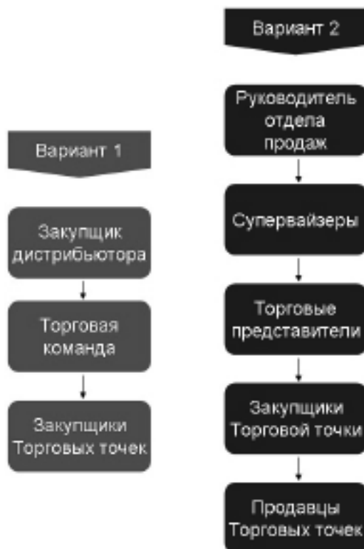
Рис.1 Товаропроводящая Цепь